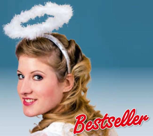
900.083.02 Heiligenschein aus Federmarabu weiß, VE 1/6