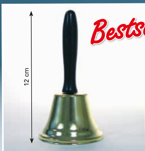
410.096.00 Glocke mit Holzgriff, ca. 12 cm hoch VE 1/12/60