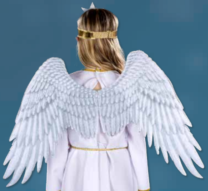
900.153.02 ein Paar Engelsflügel aus stabilem weißen Textilmaterial, beidseitig bedruckt, weiß, ca. 47x51 cm, VE 1/24