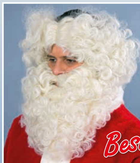
410.100.12 Bart und Stirnband flachsblond 410.102.12 Stirnband flachsblond je VE 1