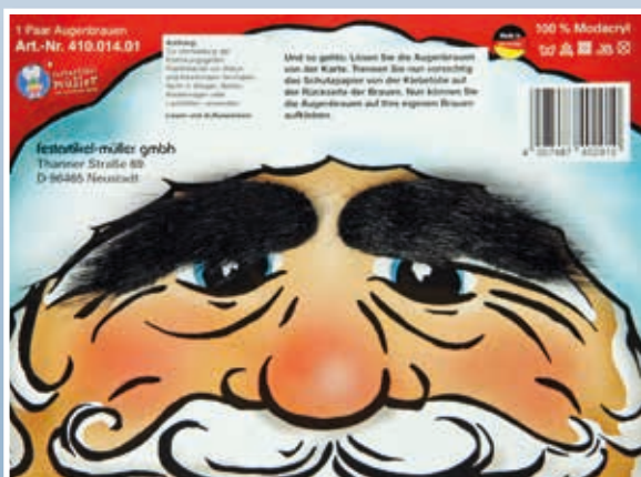
410.014.01 ein Paar selbstklebende Augenbrauen, schwarz VE 1