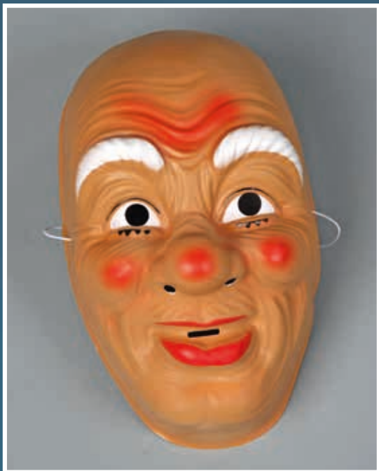
410.050.00 Hartplastik-Nikolausmaske ungarniert VE 1/72