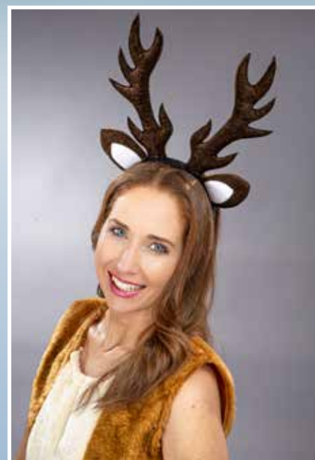
750.292.00 Rehwgeweih mit Ohren VE 1/60