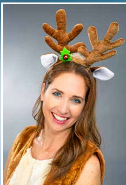
410.233.00 Rentiergeweih mit Ohren, braun VE 1/48