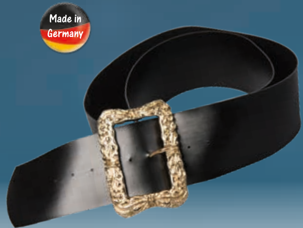
410.970.01 schwarzer Gürtel mit Prachtschließe aus Metall, ca. 8,5 x 160 cm lang, VE 1/6