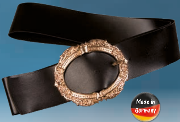
410.960.01 schwarzer Gürtel mit runder Metallschließe, ca. 5 x 110 cm, VE 1/6