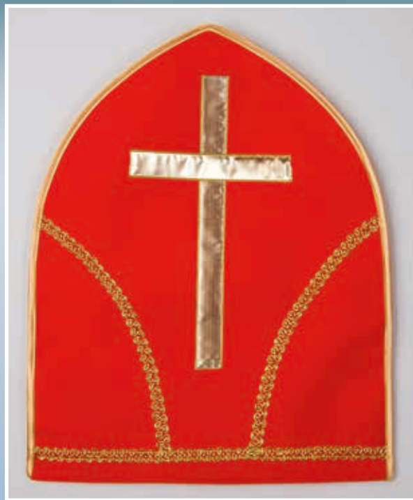
410.068.03 Bischofsmütze , Filz, VE 1

Kleine Farb- und Garniturabweichungen vorbehalten!