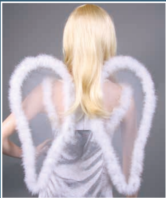
900.101.02 ein Paar transparente Engelsflügel, weiß, ca. 53 x 60 cm, VE 1/60