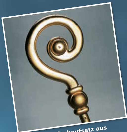
410.091.25 Stabaufsatz aus Plastik, ca. 36 cm VE 1/12