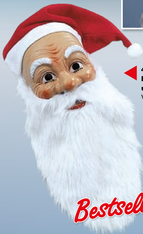
◀ 410.055.00 Hartplastik- Nikolausmaske mit Plüschbart und Flanellmütze VE 1/5