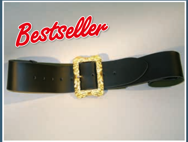
410.980.01 schwarzer Gürtel mit Prachtschließe aus Metall, ca. 5 x 150 cm, VE 1/6