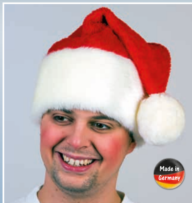
410.024.03 Nikolausmütze aus Plüsch, mit Pompon VE 1