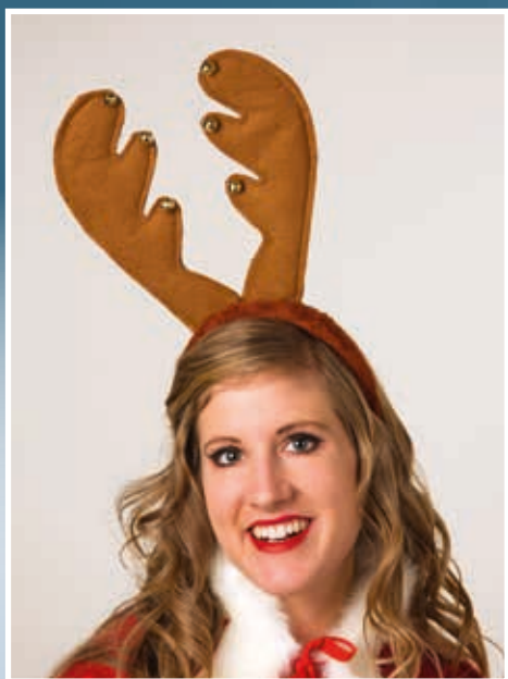
410.142.00 Rentiergeweih braun, mit Glöckchen VE 12/144