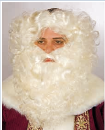
410.100.11 Bart und Stirnband weißblond 410.102.11 Stirnband weißblond je VE 1