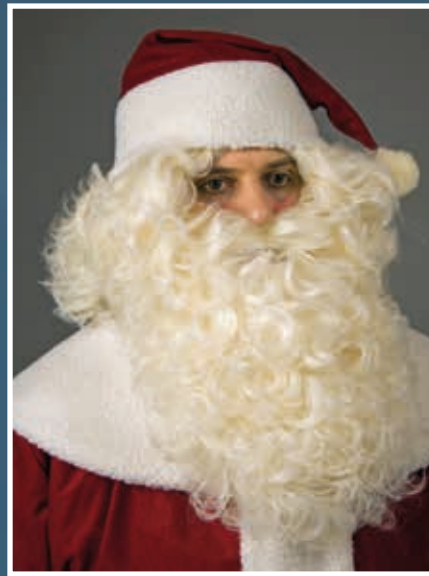
410.015.11 Set: Bart und Perücke weißblond 410.016.11 Perücke weißblond 410.017.11 Bart weißblond je VE 1