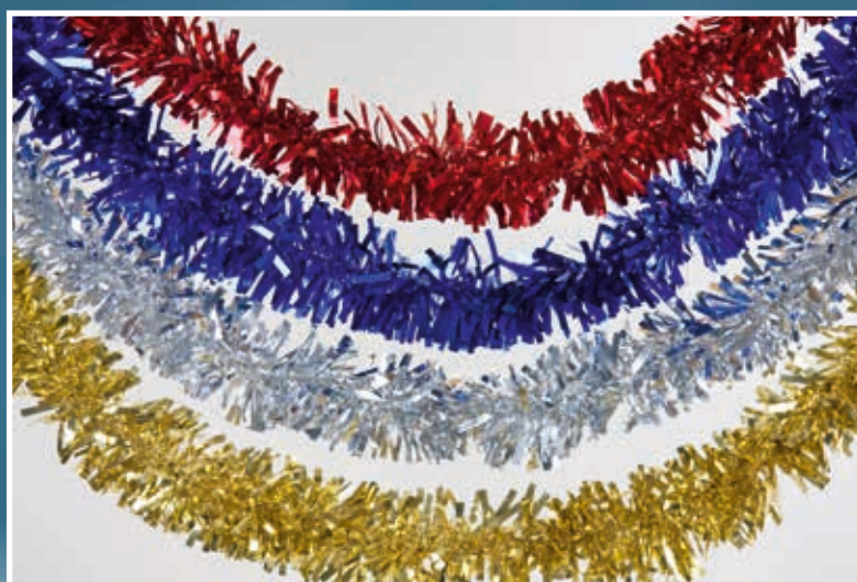
C 800.351.03 rot 800.351.17 silber 800.351.06 blau 800.351.25 gold ca. 3 m lang