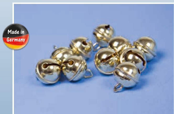
950.459.25 Packung mit 10 Schellen, ca. 19 mm Ø, vermessingt VE 1