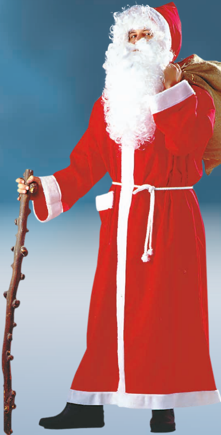
Bodenlanger Stoffmantel mit Kunstpelzbesatz, Kapuze, aufgesetzte Tasche und Gürtelkordel. 410.171.03 Universalgröße