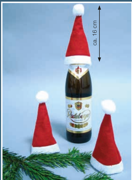
410.159.03 rote Miniaturmütze, lose VE 12