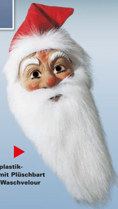
▶ 410.051.00 Hartplastik- Nikolausmaske mit Plüschbart und Kapuze aus Waschvelour VE 1/5