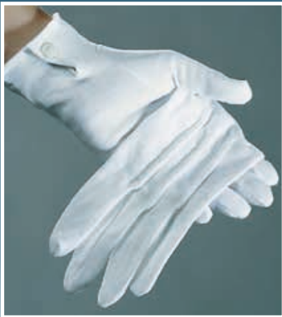
Baumwollhandschuhe mit Biesen und Druckknopf, weiß, VE 12 903.177.02 Damengrößen sortiert 906.178.02 Herrengrößen sortiert