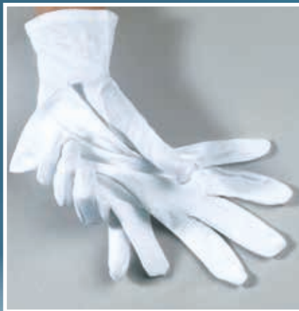
Baumwollhandschuhe weiß, VE 12 903.077.02 Damengrößen sortiert 906.078.02 Herrengrößen sortiert