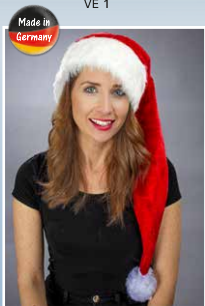
410.073.03 superlange Nikolausmütze aus Plüsch, mit Pompon VE 1