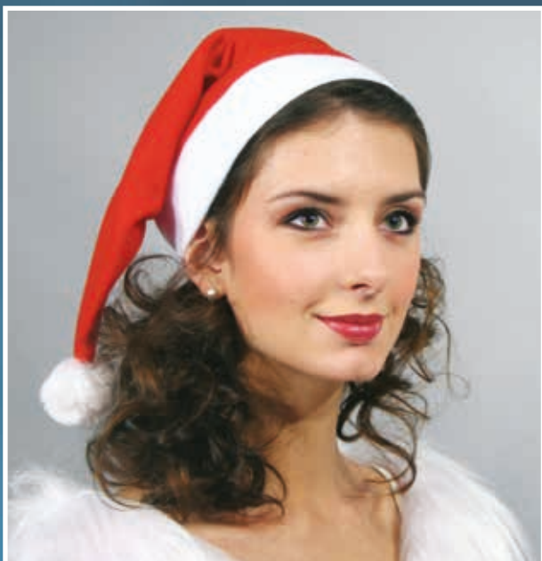
410.059.03 Nikolausmütze aus Flanell, mit Pompon VE 12/144