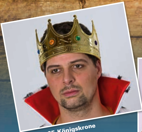
950.434.25 Königskrone für Erwachsene VE 1/6