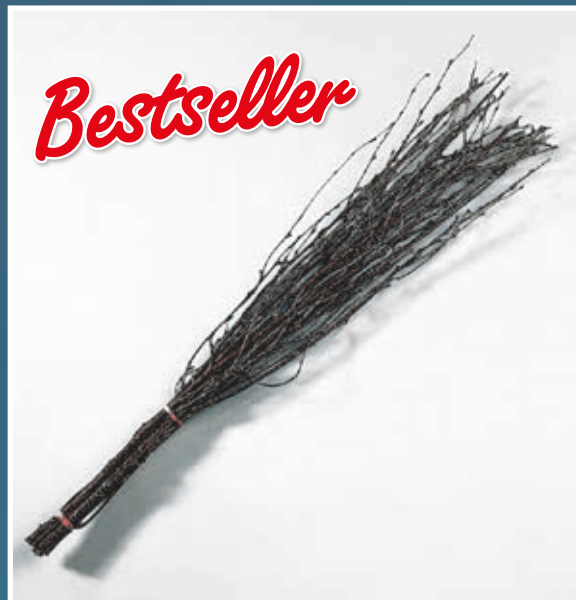
410.093.00 Nikolausrute natur, ca. 50 cm VE 1/50