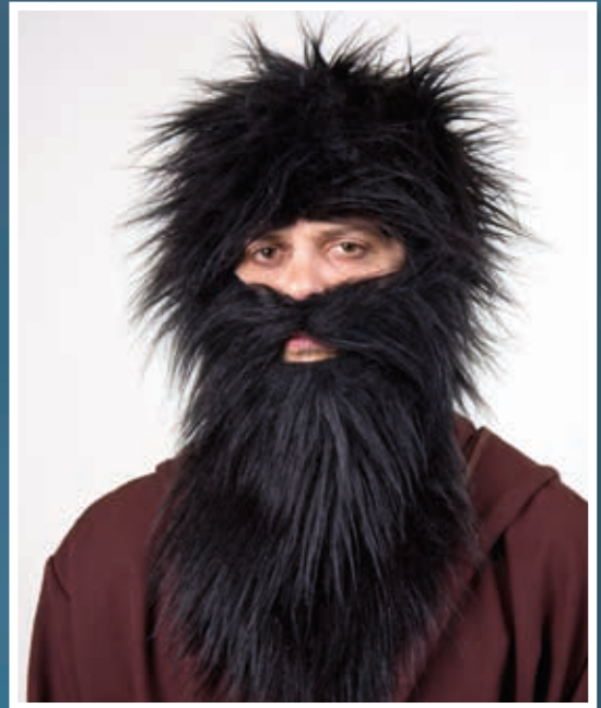
410.215.01 Ruprecht-Set: Bart und Perücke aus Plüsch schwarz 410.217.01 Ruprecht-Bart aus Plüsch schwarz je VE 1