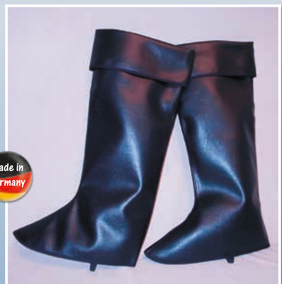
410.070.01 Stiefelgamaschen aus Kunstleder, schwarz, VE 1/6