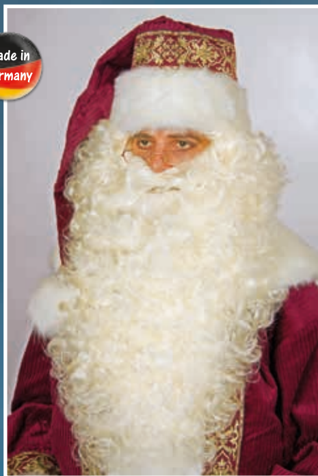
410.086.11 langer Rauschebart weißblond