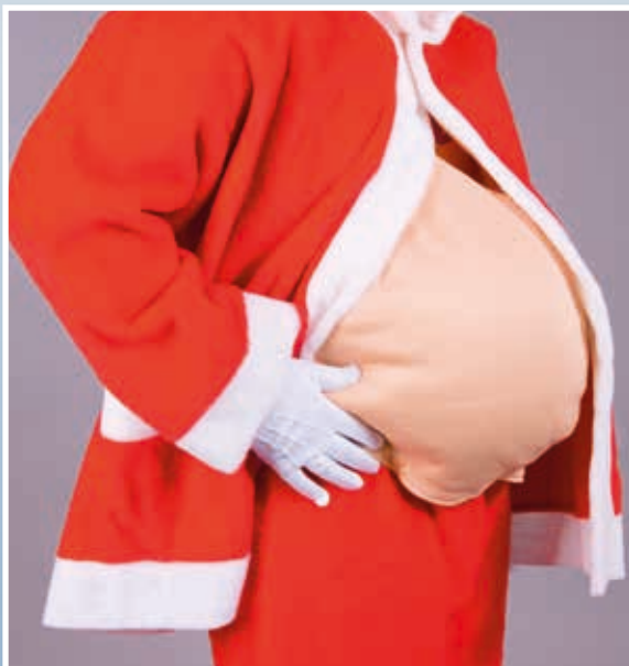
Der Weihnachtsmann ist zu dünn? Damit können Sie unseren Mänteln und Anzügen Gewicht verleihen: 900.257.00 dicker Bauch , Universalgröße, mit Nackenband und Taillengummi, VE 1/12