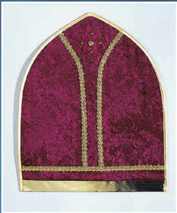
410.069.03 Bischofsmütze , Pannesamt, VE 1