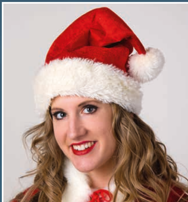
410.066.03 Nikolausmütze aus Samt mit Kuschelplüschbesatz VE 1/12