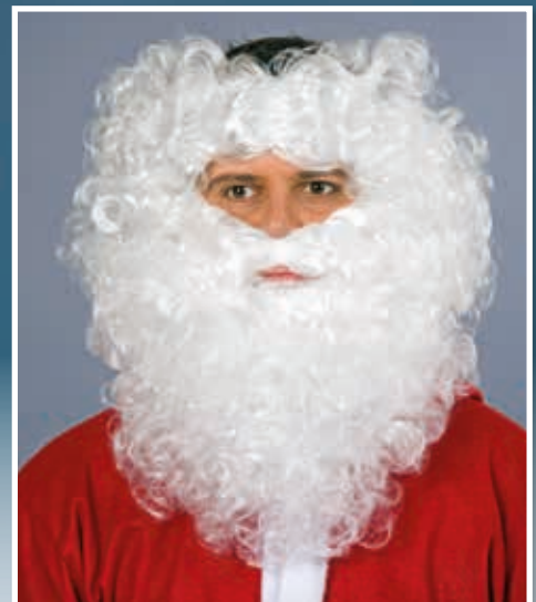
410.100.02 Bart und Stirnband weiß 410.102.02 Stirnband weiß je VE 1