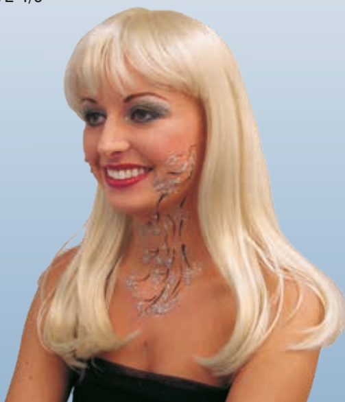
300.402.10 Langhaar-Perücke mit Pony, blond VE 1