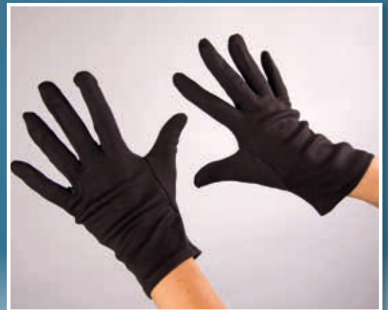
Baumwollhandschuhe schwarz, VE 12 906.078.01 Herrengrößen sortiert