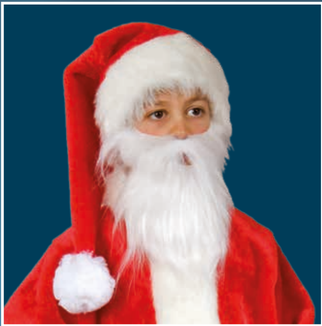
418.118.02 Kinder-Plüschbart weiß VE 1