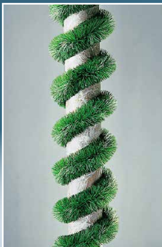
B 800.340.00 ca. 20 m lang 800.350.00 ca. 3 m lang