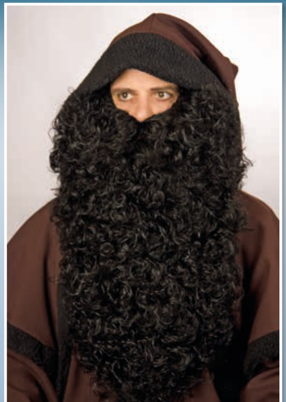
410.086.01 langer Ruprechtbart schwarz VE 1

Kleine Farb- und Garniturabweichungen vorbehalten!