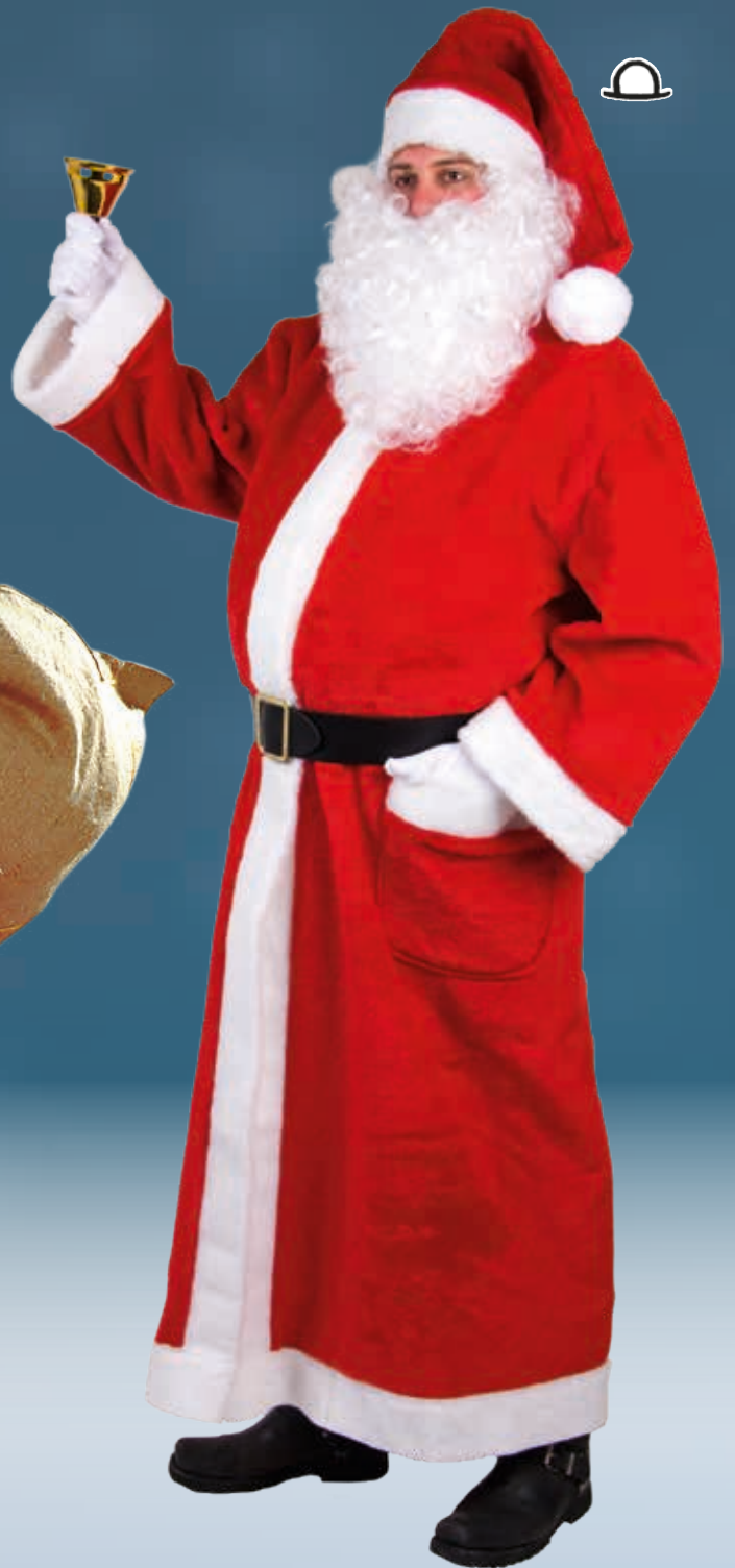
Langer Mantel aus Kunstpelz, mit Mütze, aufgesetzter Tasche und Gürtel 410.106.03 Universalgröße