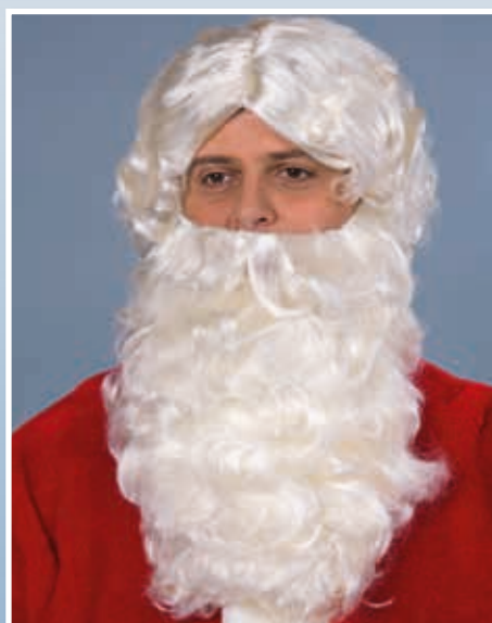
410.315.12 Set: Bart und Perücke flachsblond