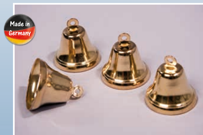
950.468.25 Packung mit 4 Glocken, ca. 38 mm Ø, vermessingt VE 1