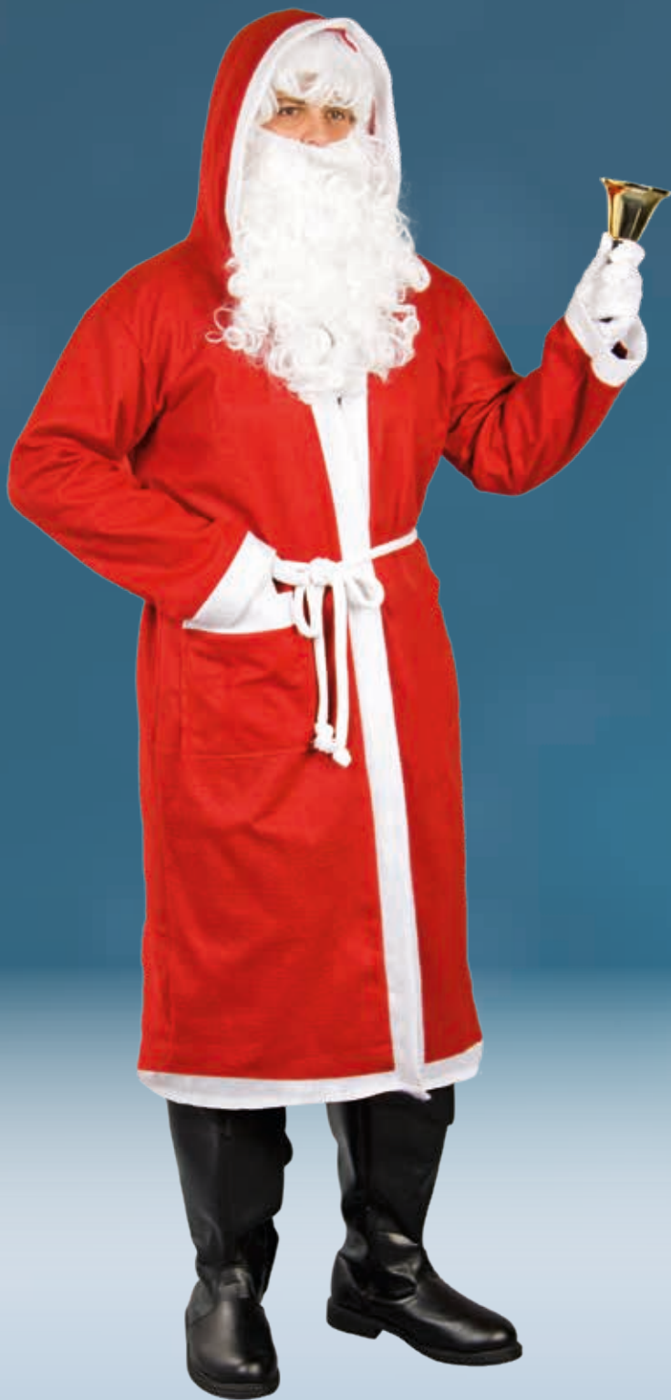
Preisgünstiger Kapuzenmantel aus Filz mit Gürtelkordel und aufgesetzter Tasche 410.010.03 Gr. M/L