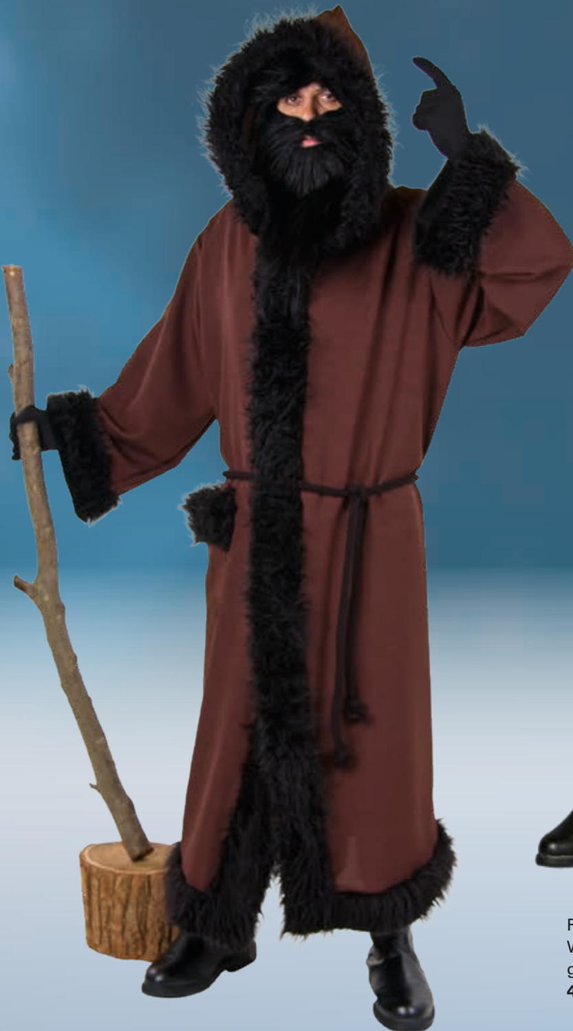
Knecht Ruprecht: brauner Stoffmantel mit Kapuze, zotteliger Kunstpelzbesatz, aufgesetzte Tasche, Gürtelkordel 410.173.08 Universalgröße