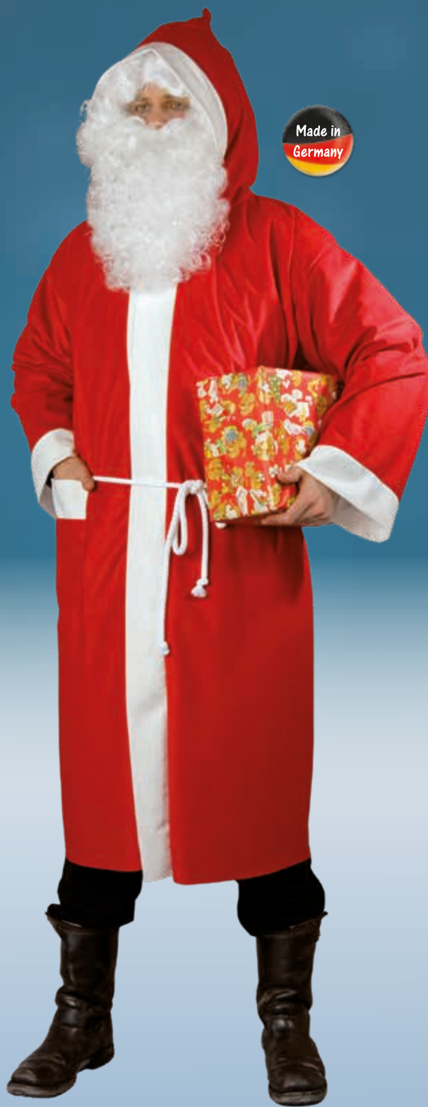
Kapuzenmantel aus Waschvelours, aufgesetzte Tasche, Gürtelkordel 410.227.03 Universalgröße