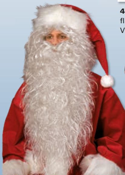
410.092.16 Bart und Stirnband grau