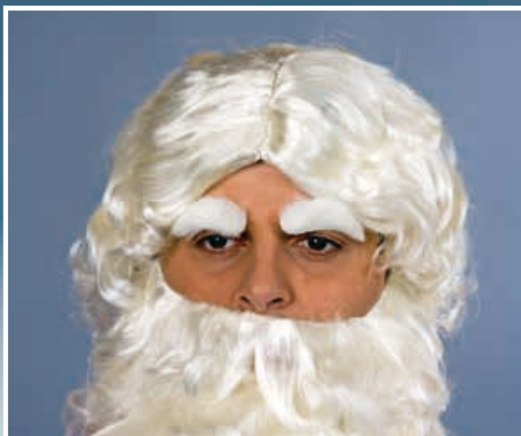
410.014.02 ein Paar selbstklebende Augenbrauen, weiß VE 1/6