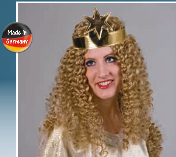
950.274.25 Sternenstirnband aus Goldfolie VE 1/6