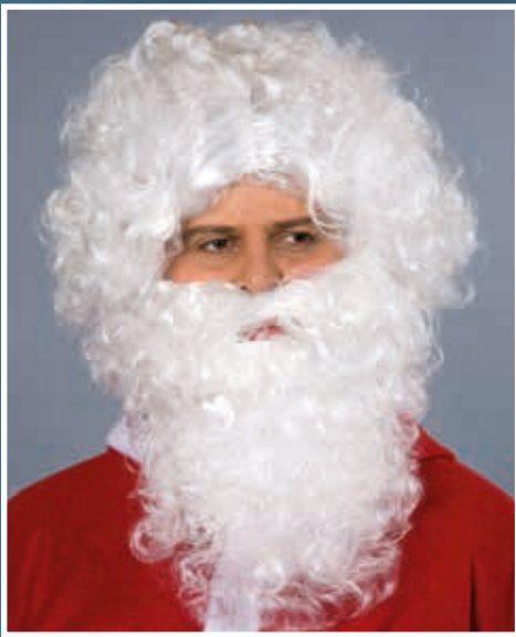
410.015.02 Set: Bart und Perücke weiß 410.016.02 Perücke weiß 410.017.02 Bart weiß je VE 1