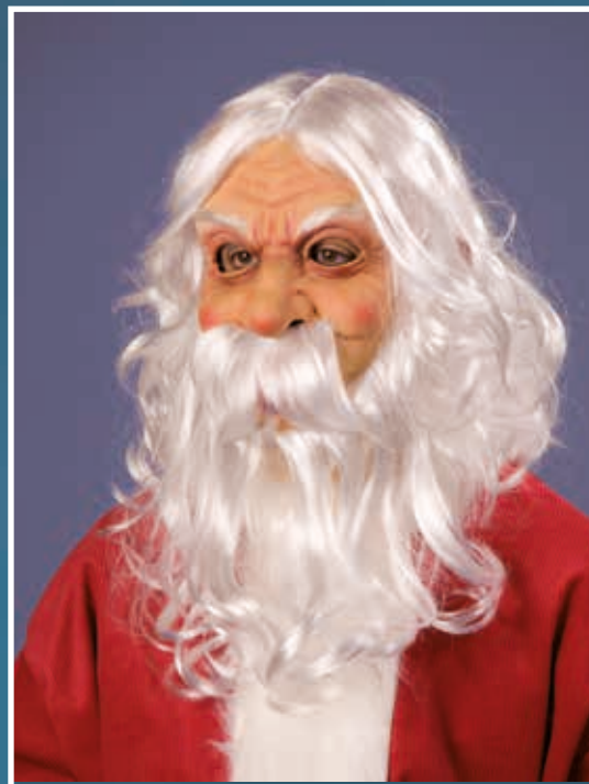
169.312.00 Nikolaus-Latexmaske mit Haar und Bart VE 1