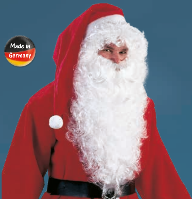
410.086.02 langer Rauschebart weiß