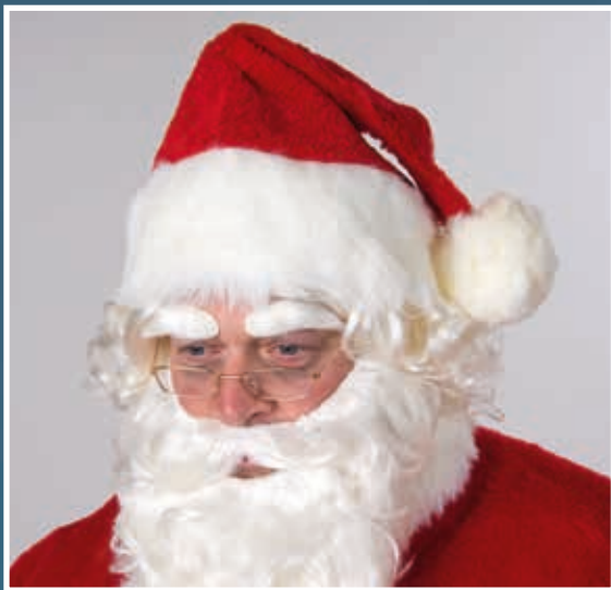
100.037.00 eckige Metallbrille mit Gläsern VE 1/12