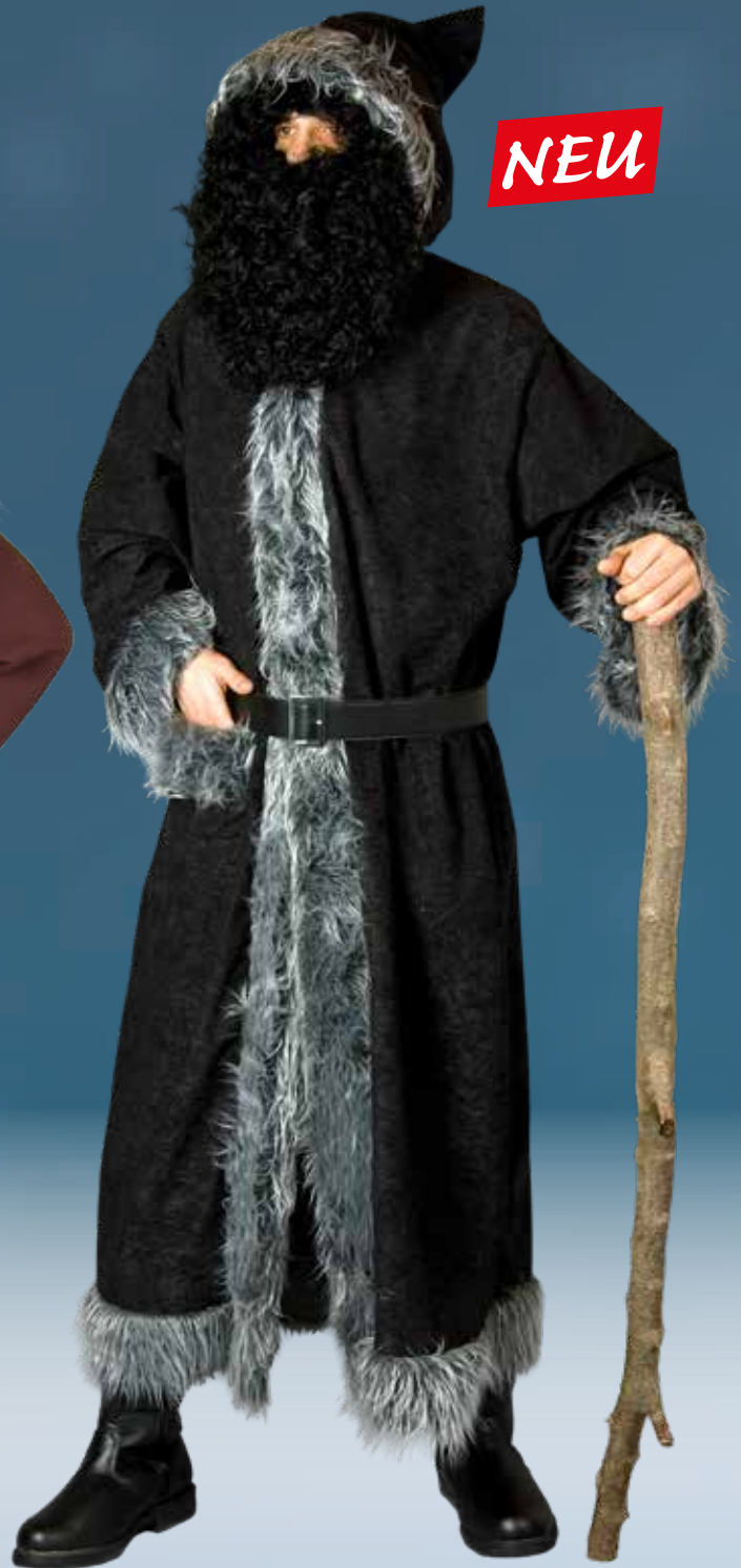
Ruprechtmantel mit Kapuze aus schwarzem Waschvelours mit einem Besatz aus zotteligem Kunstpelz. Aufgesetzte Tasche, Gürtel. 410.280.01 Universalgröße

Kleine Farb- und Garniturabweichungen vorbehalten!