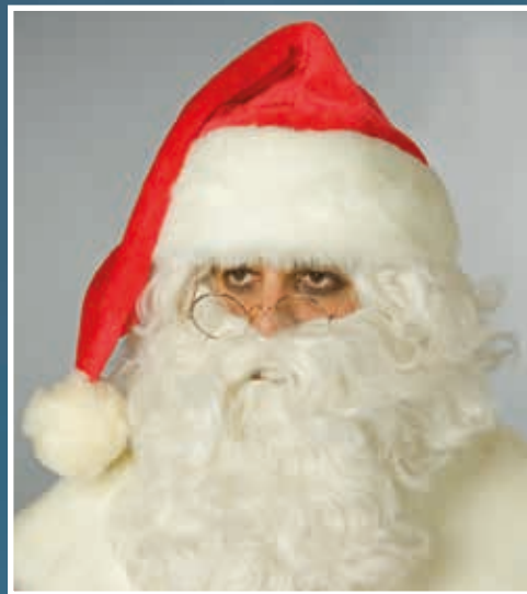
100.026.00 nostalgische runde Metallbrille mit Gläsern VE 1/24