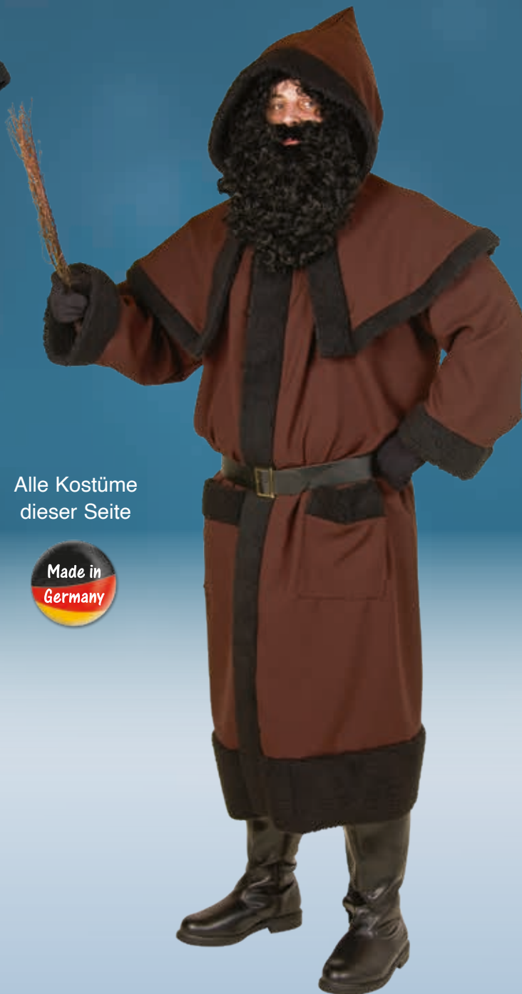
Pelzermärtl, Knecht Ruprecht, Schmutzli... der braune Stoffmantel mit Kapuze und Pellerine ist mit schwarzem Kunstpelz in Lammfell-Optik abgesetzt. Zwei aufgesetzte Taschen, Gürtel 410.278.08 Universalgröße