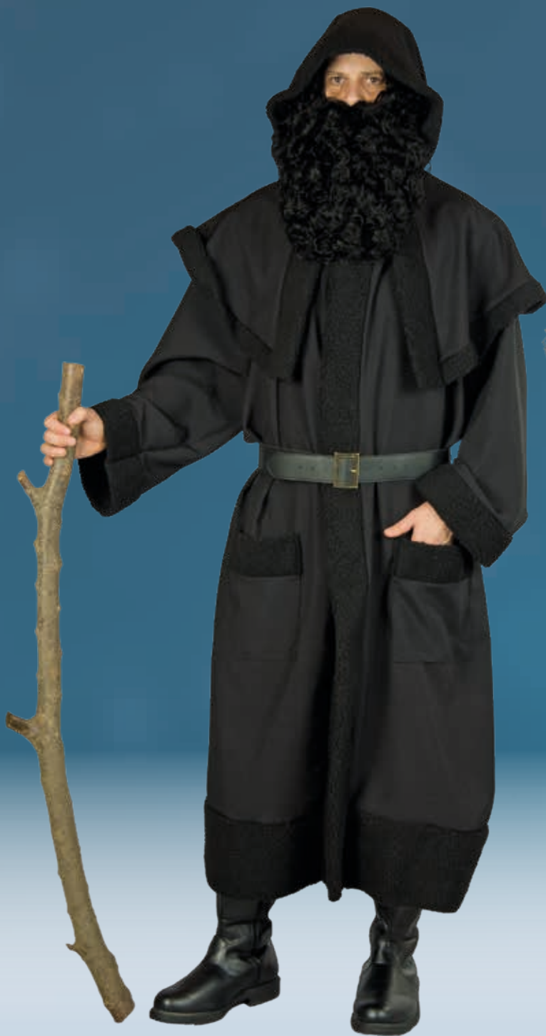
Pelzermärtl, Knecht Ruprecht, Schmutzli... schwarzer Stoffmantel mit Pellerine und Kapuze, zwei aufgesetzte Taschen, Besatz aus schwarzem Kunstpelz in Lammfell-Optik, Gürtel 410.278.01 Universalgröße