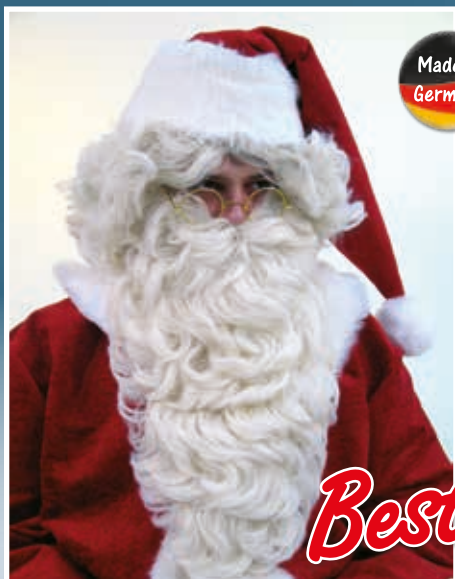
410.086.12 langer Rauschebart flachsblond