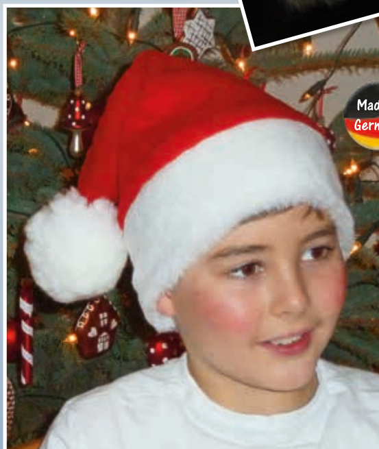
418.025.03 Kinder-Nikolausmütze aus Plüsch, mit Pompon VE 1