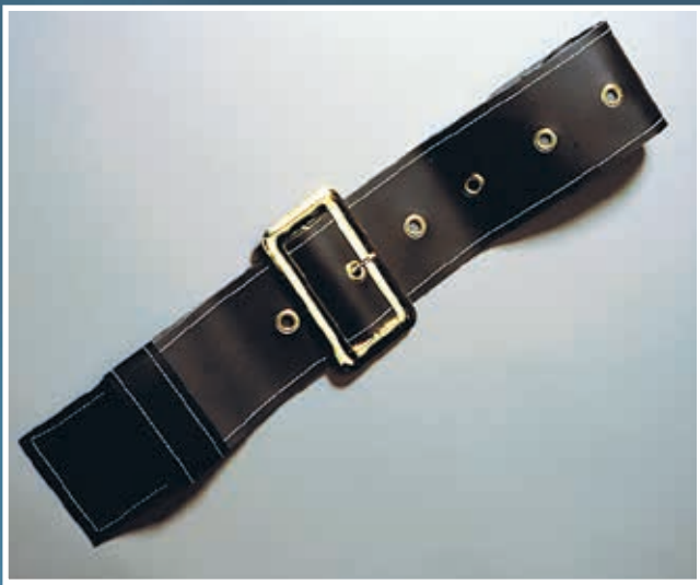
410.990.01 schwarzer Gürtel mit Metallschließe, ca. 9 x 135 cm, VE 1/144