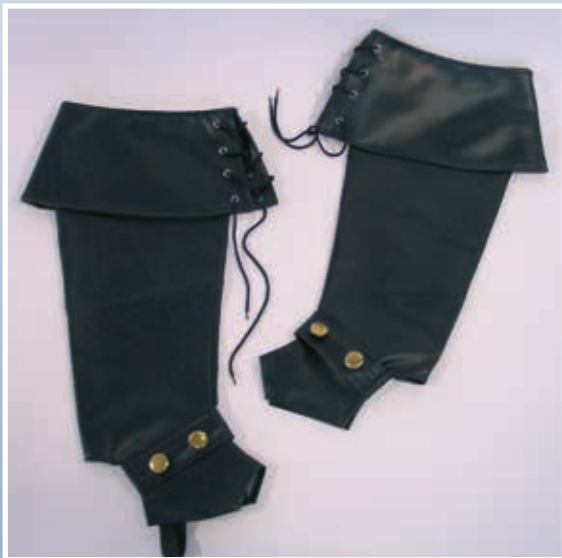
900.411.00 Stiefelgamaschen aus Kunstleder, schwarz, VE 1/12