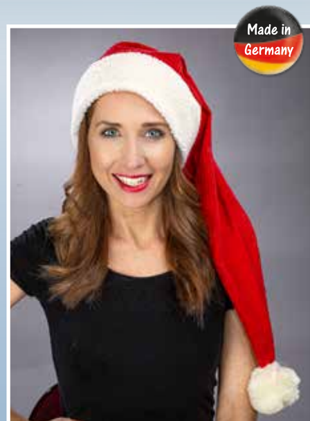
410.074.03 superlange Nikolausmütze aus Kordsamt, mit Pompon VE 1

Kleine Farb- und Garniturabweichungen vorbehalten!