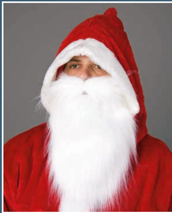
410.119.02 Plüschbart weiß VE 1