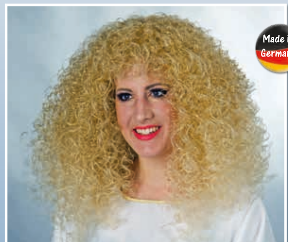
300.338.10 Christkind-Perücke gelockt, blond, mit Goldfäden VE 1

Kleine Farb- und Garniturabweichungen vorbehalten!