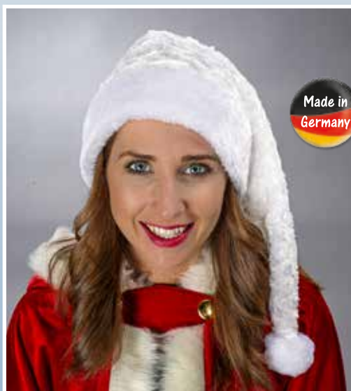
410.075.02 lange Nikolausmütze aus weißer Wirbelchenille, mit Pompon VE 1