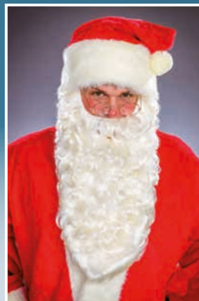
410.186.12 langer Rauschebart flachsblond