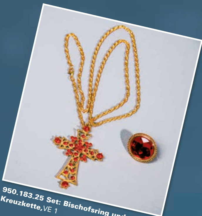
950.183.25 Set: Bischofsring und Kreuzkette, VE 1