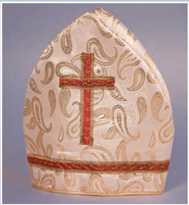
410.058.00 Bischofsmütze mit Falte , Brokat, größenverstellbar, VE 1