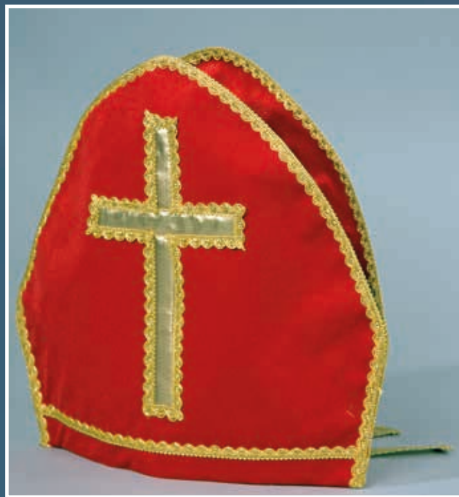
410.168.03 Bischofsmütze mit Falte und Bändern , Samt, größenverstellbar, VE 1