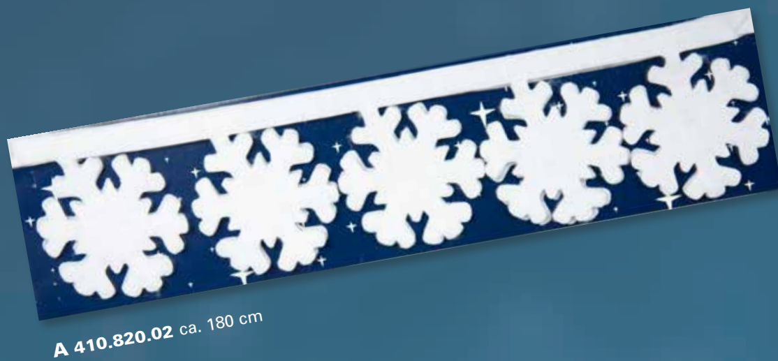
A 410.820.02 ca. 180 cm