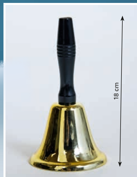
410.098.00 Glocke mit Holzgriff, ca. 18 cm hoch VE 1/12