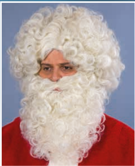
410.015.12 Set: Bart und Perücke flachsblond 410.016.12 Perücke flachsblond 410.017.12 Bart flachsblond je VE 1